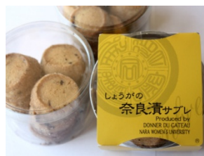
奈良の食プロジェクト開発商品例